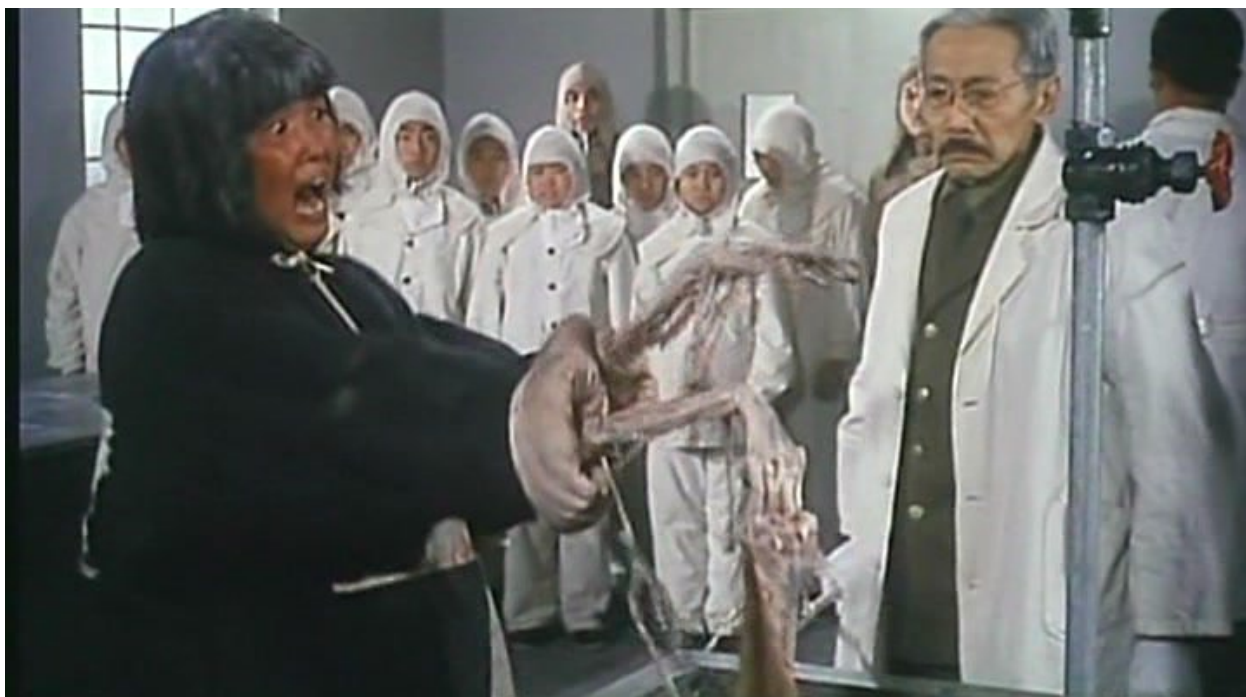
Отряд №731. Наблюдение за зараженными