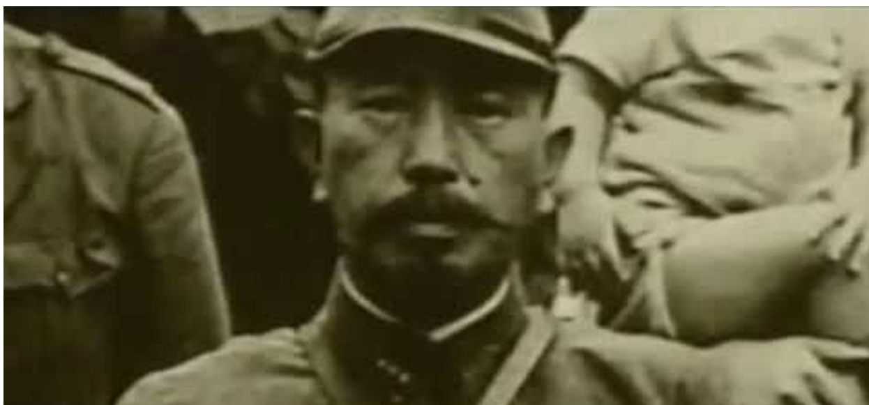
Генерал-лейтенант медслужбы Исии Сиро