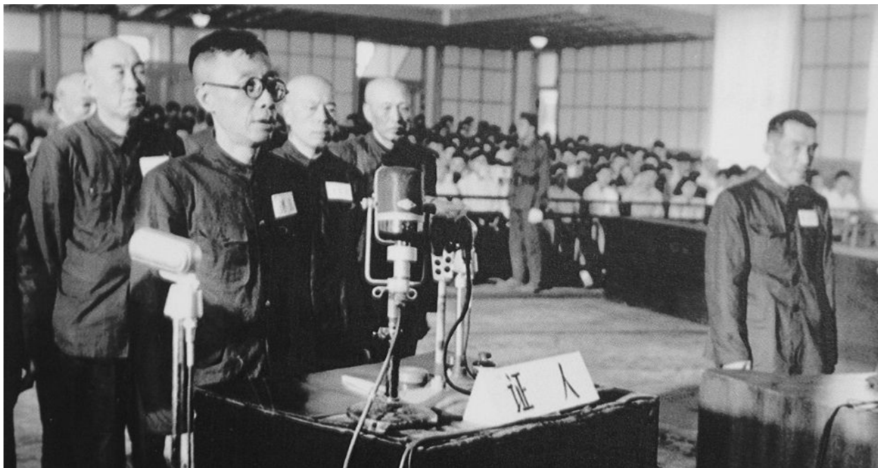
Хабаровск 1949 г. Суд над японскими военными преступниками из отряда № 731